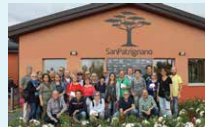
San Patrignano (RN)

Cultura. La cultura dei sordi è sempre tesa verso nuovi orizzonti. Si arricchisce grazie alle diverse iniziative proposte dall'attuale consiglio provinciale. Cultura è viaggio, è sensibilità, è scoperta.