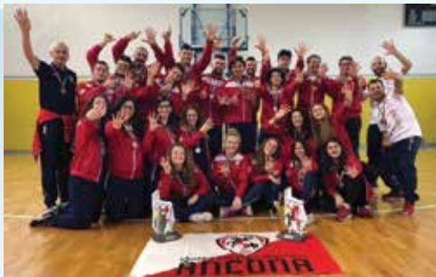
Pallavolo Maschile e Femminile