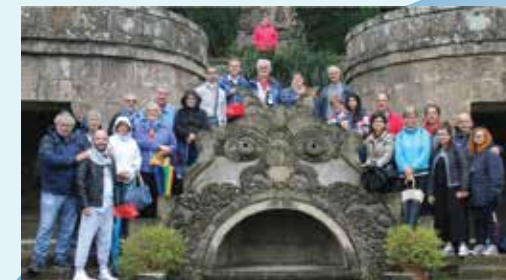
La Scarzuola (TR)