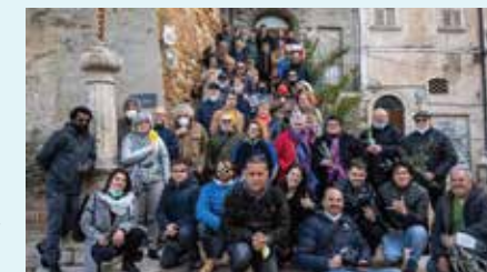
Pasqua del Sordo, Spinetoli (AP)