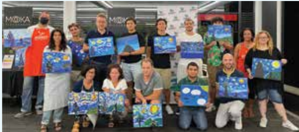
Appennellis Senigallia (AN)

Gruppo giovanile. Giovani dai 18 ai 30 anni, belli, svegli e simpatici. Iperattivi e comunicativi, una vera macchina organizzativa di feste, uscite, manifestazioni all'insegna del divertimento e della voglia di stare insieme! Venite con noi e non vi pentirete, vi aspettiamo a braccia aperte!!