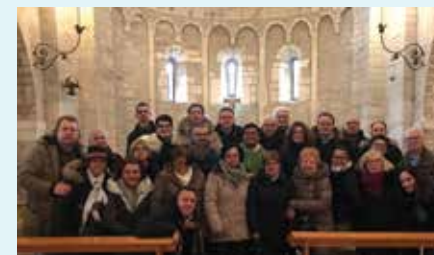
Sant'Urbano di Apiro (MC)

Tradizione e ricorrenza. Ogni anno ci sono le ricorrenze da rispettare come l'Anniversario di Fondazione, San Francesco di Sales patrono dei sordi e la Pasqua del Sordo.